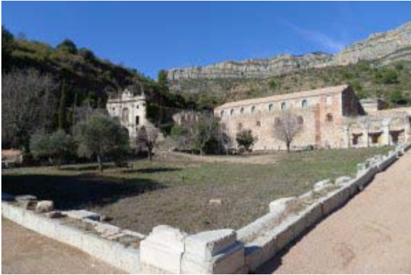
Claustre dels rosers

La cartoixa d'Escaladei es troba al fons d'una vall, protegida per la serralada de Montserrat. En aquest espai tranquil, els monjos cartoixans van seguir un model de vida marcat pel silenci i l'oració, combinant la solitud eremítica amb l'empara de la vida comunitària.